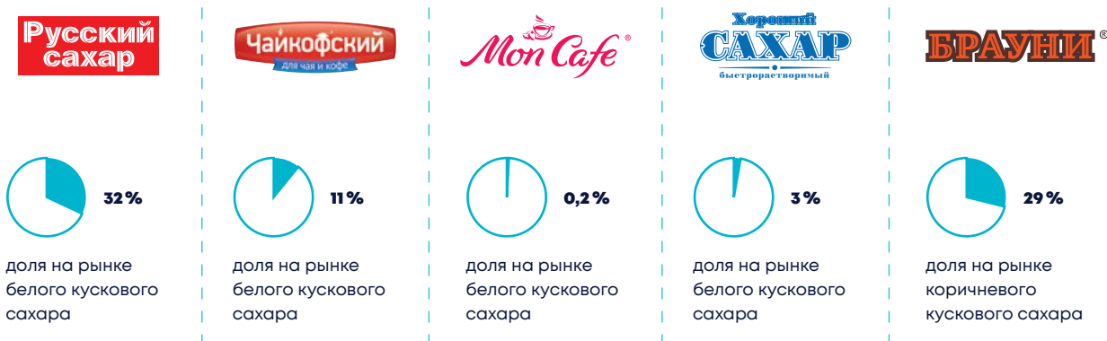
Доля брендов сахарной продукции «Русагро» на рынке России, %

«Русагро» уже много лет является лидером на российском рынке белого и коричневого кускового сахара. Суммарная доля брендов «Русский сахар», «Чайкофский», «Хороший» и Mon Café составила 46% на рынке белого кускового сахара, а «Брауни» – 29% на рынке коричневого кускового сахара. Бренд «Хороший», запущенный в августе 2020 г. для удовлетворения растущего спроса на продукцию низкого ценнового сегмента, занял 3%. Самым сильным брендом белого кускового сахара снова стал «Русский сахар» с долей 32%, узнаваемостью 90% и лояльностью покупателей 59%.